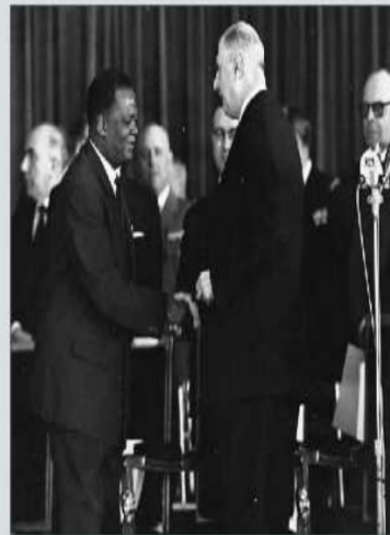
Le Général de Gaulle avec un chef d'état africain